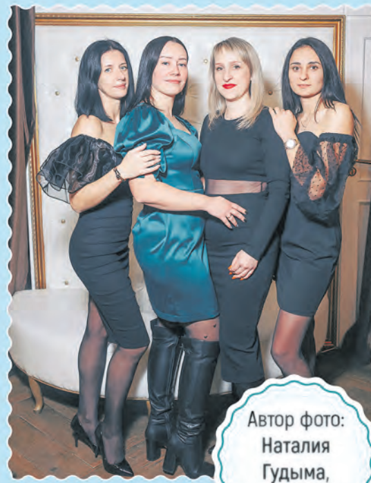
Автор фото: Наталья Гудыма, Гродно

Подробности конкурса на сайте belchas.1prof.by