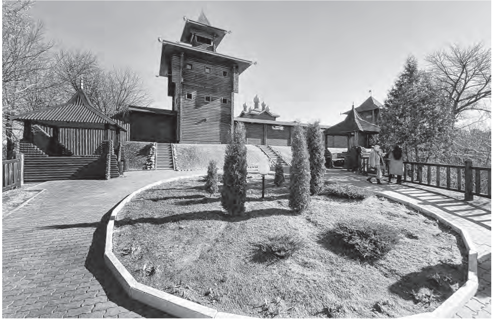
Со смотровой площадки замка открывается чудесный вид на город Мозырь, а также на набережную стремительной реки Припять.

Мозырь – город Белорусского Полесья, который своими пейзажами с первого взгляда влюбляет туристов. «Белорусская Швейцария» – так называют живописный регион местные жители. Одна из его визитных карточек – возвышающийся на горе деревянный замок.