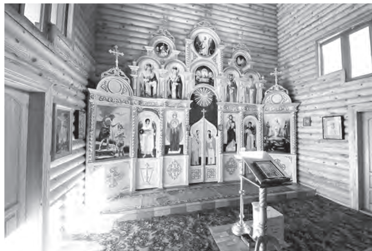
Храм Преображения Господня построен на том самом месте, где прежде располагалась замковая церковь Святого Спаса.

– Ранним утром 29 января 1649 года начался штурм Мозыря. Повстанцы несколько раз отбрасывали противника от своих укреплений, но долго противостоять хорошо обученной армии не смогли. Замок, а вместе с ним и значительная часть центра города были сожжены. Вместе с цитаделью сгорел и