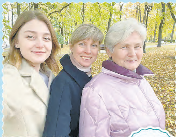
Автор фото: Наталья Марченко, Жлобин