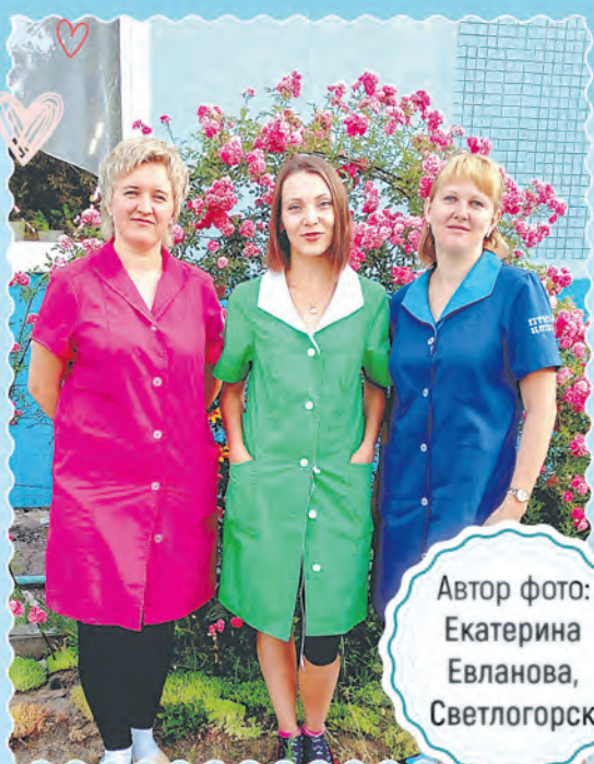
Автор фото: Екатерина Евланова, Светлогорск