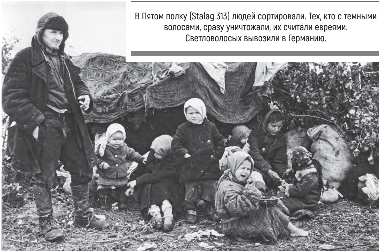
Освобожденные узники концлагеря «5-й полк» под Витебском. 1944 год.

В Пятом полку (Stalag 313) людей сортировали. Тех, кто с темными волосами, сразу уничтожали, их считали евреями. Светловолосых вывозили в Германию.