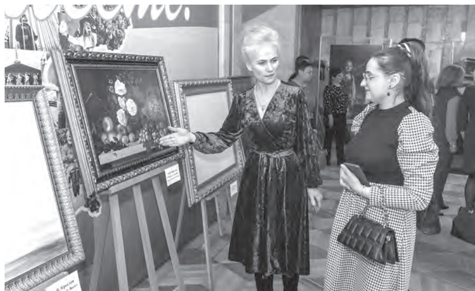
Для участников пленума была развернута выставка работ номинантов на премию ФПБ 2023 года в области литературы, искусства, журналистики и любительского творчества.