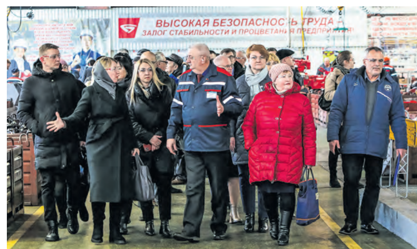
Участники семинара-совещания по охране труда изучили в том числе опыт МТЗ по созданию безопасных условий на рабочих местах.

Все случаи профзаболеваний выявлены при проведении обязательных медосмотров работающих, что подтверждает значимость таких процедур.