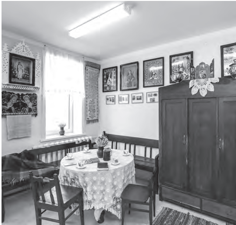
В коллекции Рымдюнской музейной комнаты более 500 экспонатов.