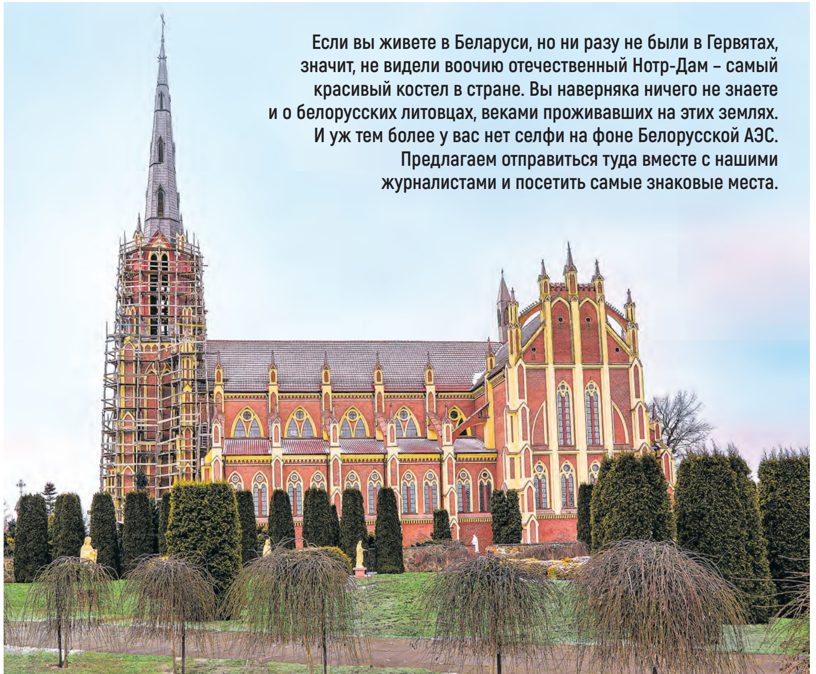
Троицкий костел в Гервях единственный в Беларуси соответствует всем канонам неоготики.

«Костел – наше общее достояние, поэтому всегда откликаемся на просьбы его настоятелей», – объясняет председатель