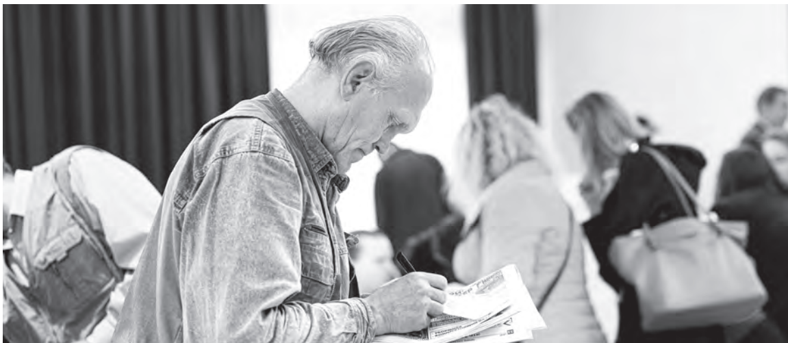
На профсоюзные правовые приемы люди приходят в том числе и с вопросами о пенсиях и пособиях.

Наталья МАРЦИНКЕВИЧ Фото носит иллюстративный характер