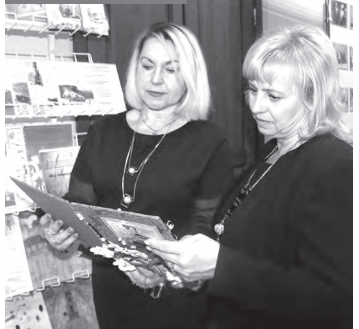
Специалисты Могилевской областной организации профсоюза работников образования и науки представили на пленуме экспозицию конкурсных работ, созданных в различных учреждениях образования.