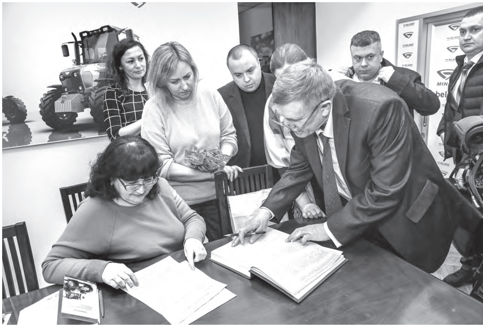
Перед посещением корпуса сборки тракторов на МТЗ участники семинара-совещания прошли инструктаж по технике безопасности.