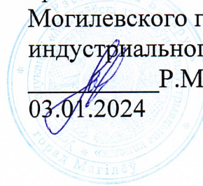
График проведения занятий ШАГ «Школы активного гражданина» учреждения образования «Могилевский государственный индустриальный колледж» 1 квартал 2024 года