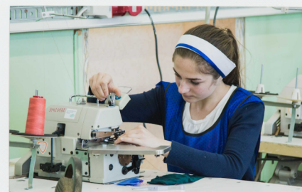
Оператор швейного оборудования